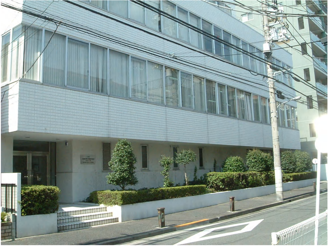
■ 東京支社 ■